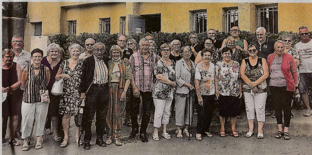
Les membres du Club de l'amitié n'ont pas boudé leur plaisir de se retrouver

Le "petit" monde de Nelly est composé de plus de cinquante adhérents. Trente étaient présents ce jour-là, impatients de découvrir les changements annoncés au calendrier. Certains ont réclamé plus de lots. Actuellement, un par mois se déroule. Nelly voudrait bien, mais